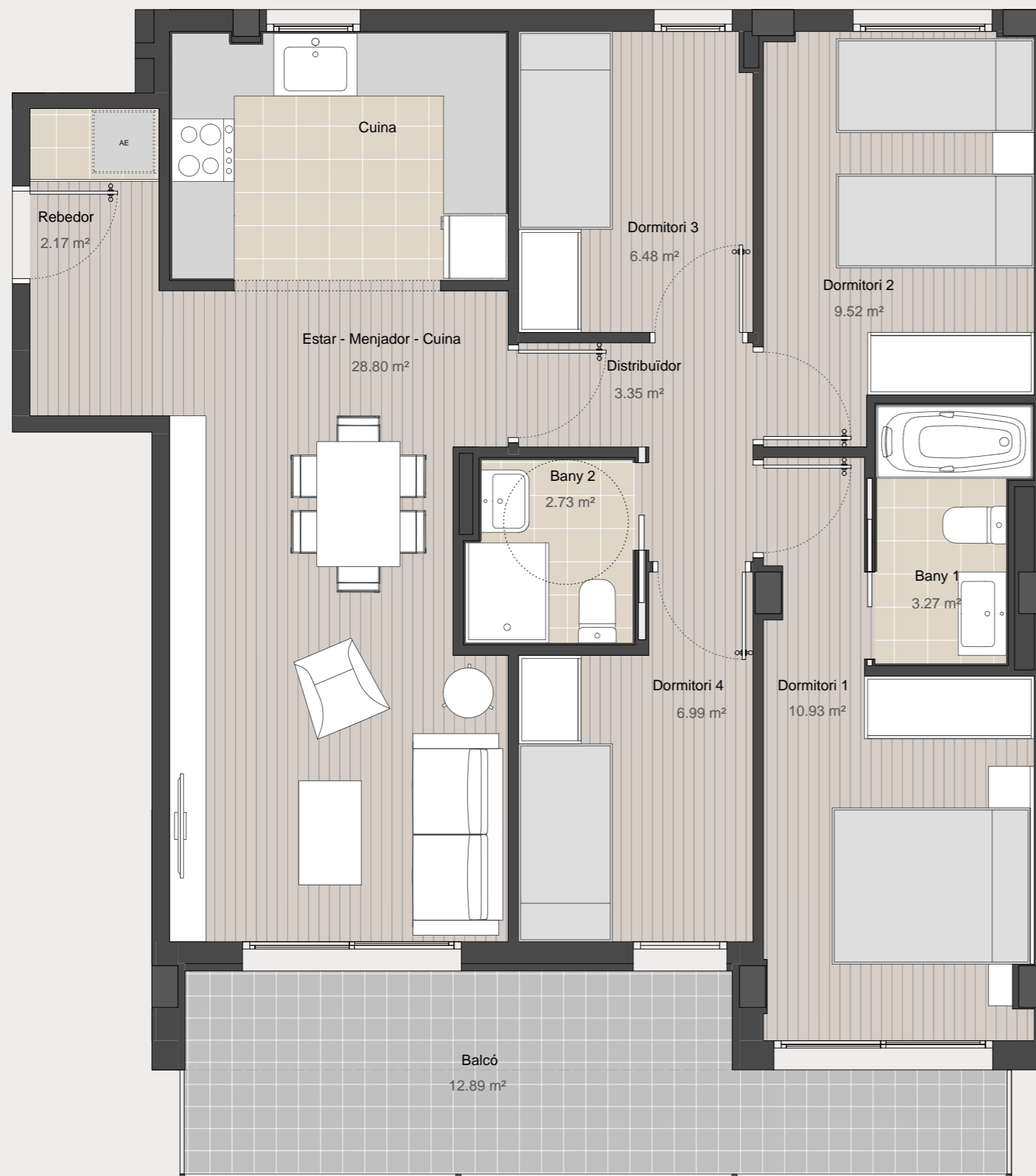
Carrer del Canal de la Infanta