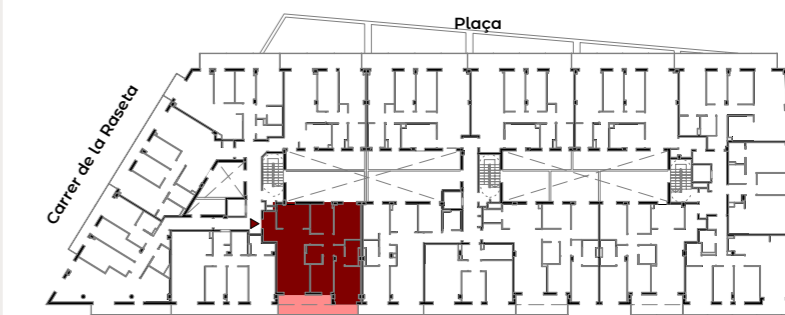
Carrer del Canal de la Infanta